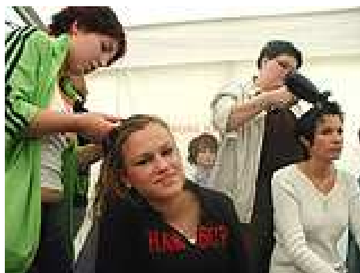
Auszubildende der Friseur-Innung

Was erfährst du in diesem Berufsfeld über die Erfahrungen von Jungen und Mädchen, von Männern und Frauen? Kannst du darauf hin Jungen zu sog. „Frauenberufen“ und Mädchen zu sog. „Männerberufen“ raten? Begründe!