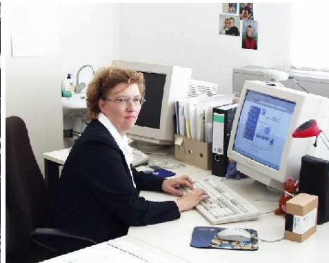
Arbeit in einer Konservenfabrik. Auch heute noch ist dies „typische Frauenarbeit“. Telearbeit, eine Tätigkeit eher für Frauen?